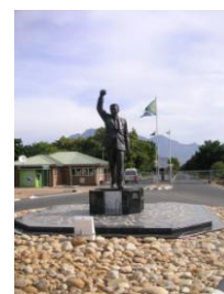
Paysages des la route des vins et domaines viticoles – La statue de Mandela à la prison de Drakenstein