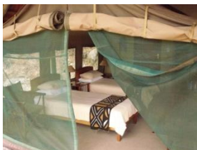
Camp de Balule