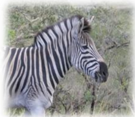
Zèbre de Burchell