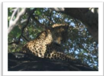
Guépard au repos

Transfert en début d'après-midi du jour 6 pour l'aéroport de HOEDSPRUIT, envol vers JOHANNESBURG avant votre retour en France