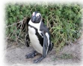
Le Parc du Cap offre refuge aux autruches et les eaux froides de la côte déchiquetées aux pingouins