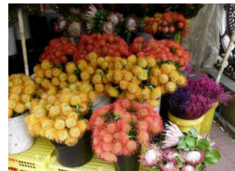
Quartier malais – Relève de la garde à la citadelle et marché » aux fleurs