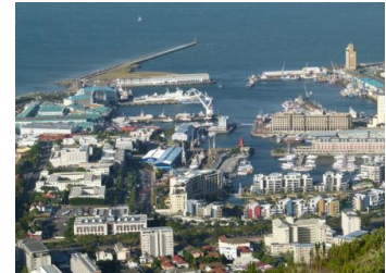
La montagne de la table et la le water front vu de Canonkoop