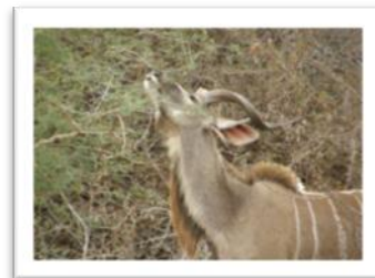
Antilope Kudu male